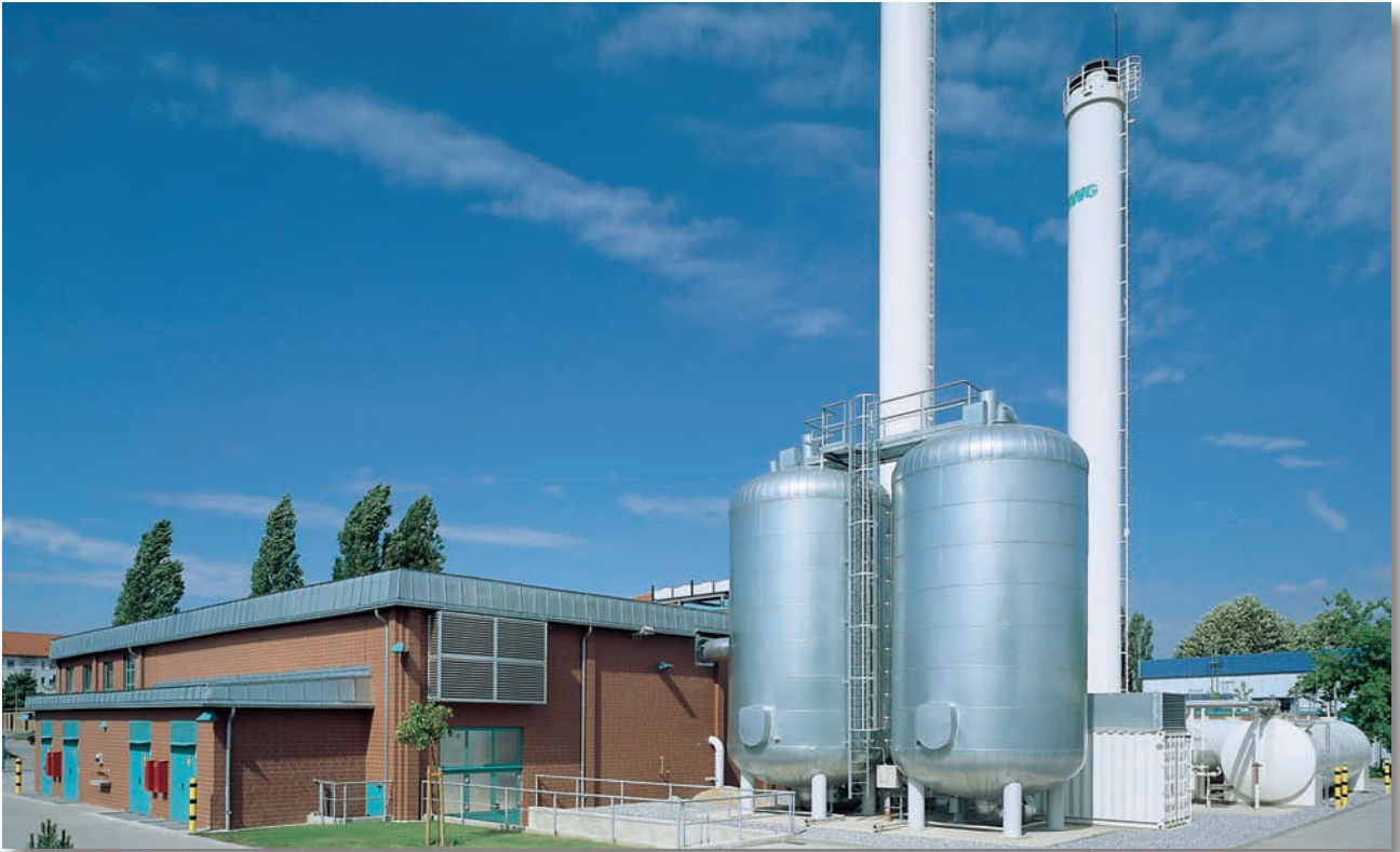
Blockheizkraftwerk Südstadt, Güstrow