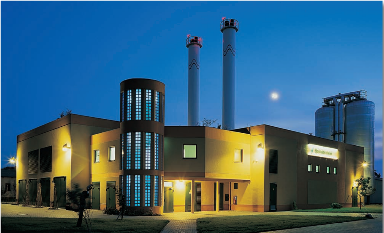
Blockheizkraftwerk Heinrich-Rau-Str., Neuruppin