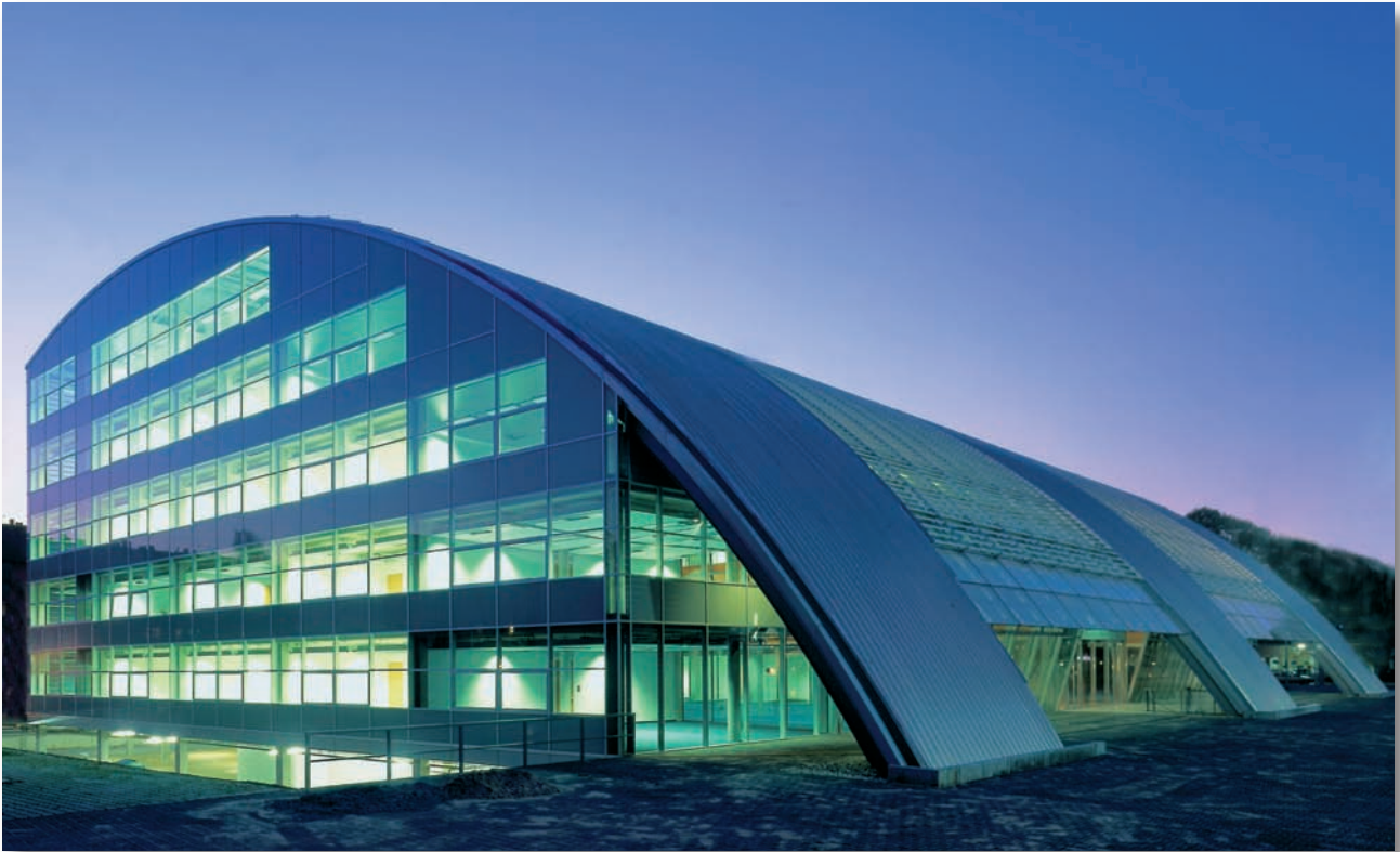
Sprinkleranlage MEC Duisburg